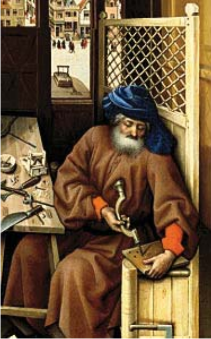
Heilige Jozef door Robert Campin

jonge man en hij werd veel vaker alleen afgebeeld. Hij kreeg in de Italiaanse en Spaanse kunst ook verschillende attributen. Zo beeldde men hem vaak af met een lelie, als symbool van de reinheid. De bloeiende lelie verwijst eveneens naar de bloeiende staf uit het apocriefe evangelie. Daarnaast schilderde men Jozef met verschillende timmermanswerktuigen en in verband met Jezus komt de Heilige Jozef voor in nieuwe zelfstandige scènes: