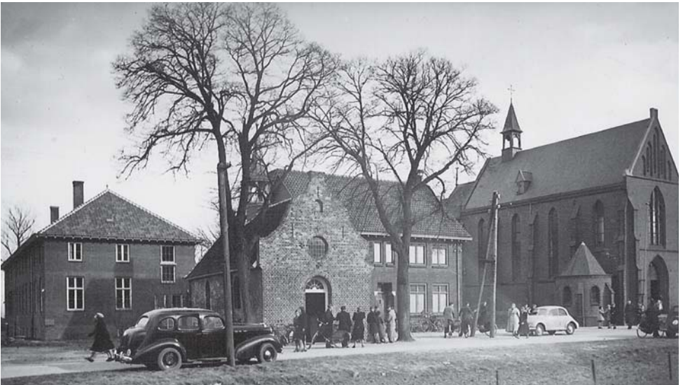
Smakt voor WO-II: Rechts achter de bidkapel, de rector's woning en de oude kerk