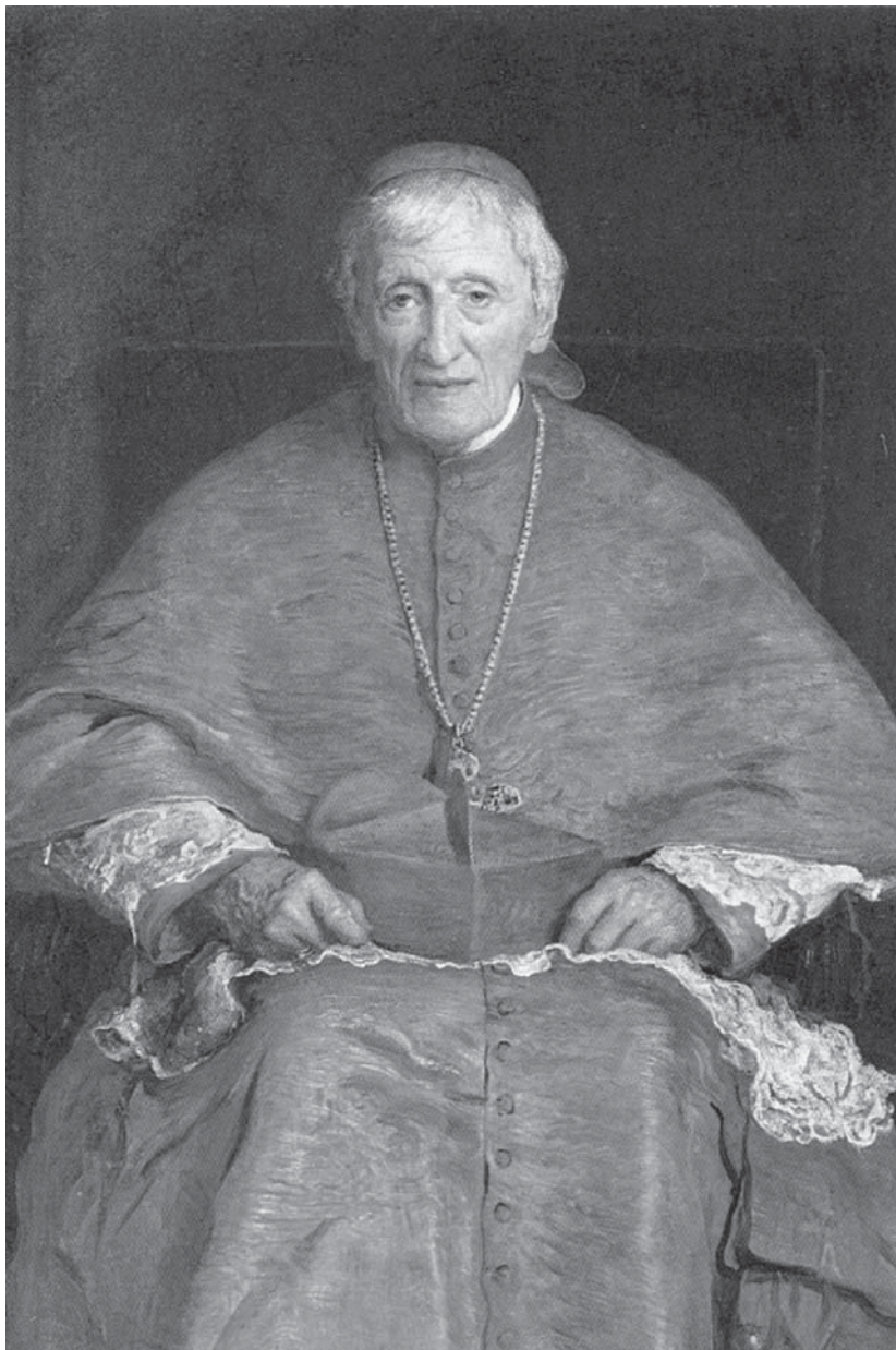
Zalige John Henry Newman